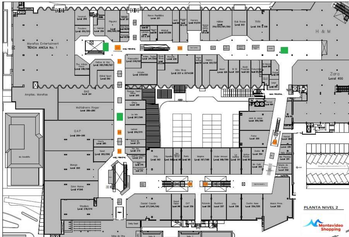
Plano nivel 2. Ubicaciones de 3 intervenciones, a confirmar.