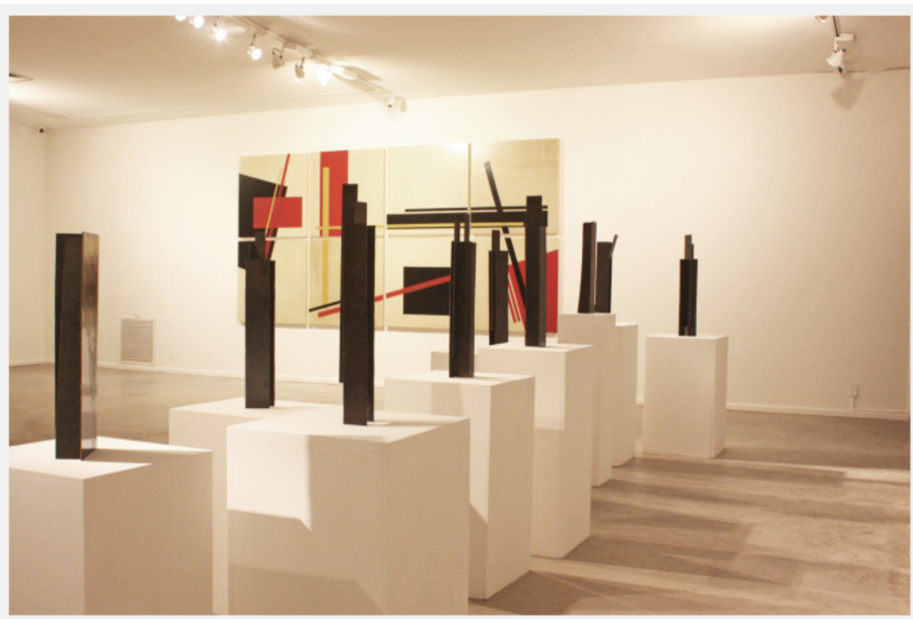
Vista en la que se entremezclan pintura y escultura, teoría y práctica, trama y altura, arquitectura y ciudad. Sala de exposiciones, marzo 2015 Fundación Pablo Alchugary

Pertenece a una época donde todo es muy dinámico, internet cambió la velocidad de las cosas y nuestra propia velocidad, todo es más efímero, creo que de cierta manera el arte también. Con ello no hablo de contenidos. Mi trabajo a lo largo de los años se caracteriza por ser muy dinámico. Me interesa el fin, más que el medio, la cuestión que planteo en cada momento, en general vinculado al conocimiento teórico relacionado a la arquitectura y a la ciudad.