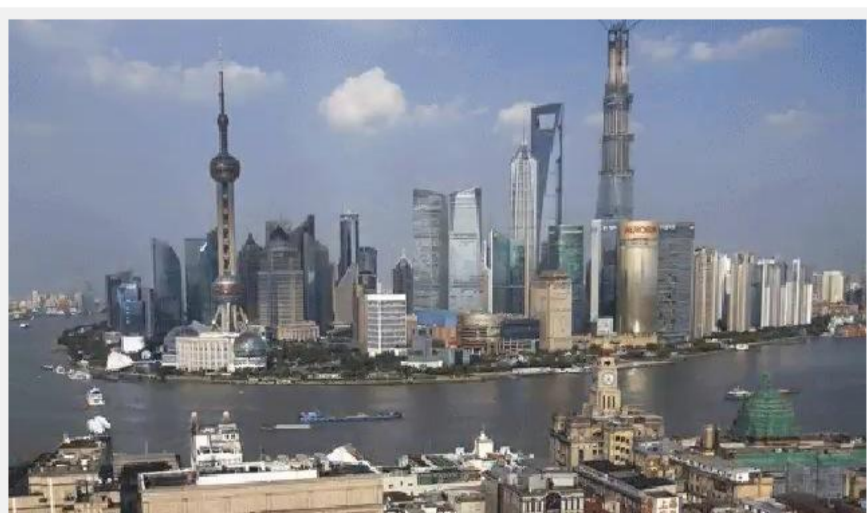
Shanghai en el año 2014