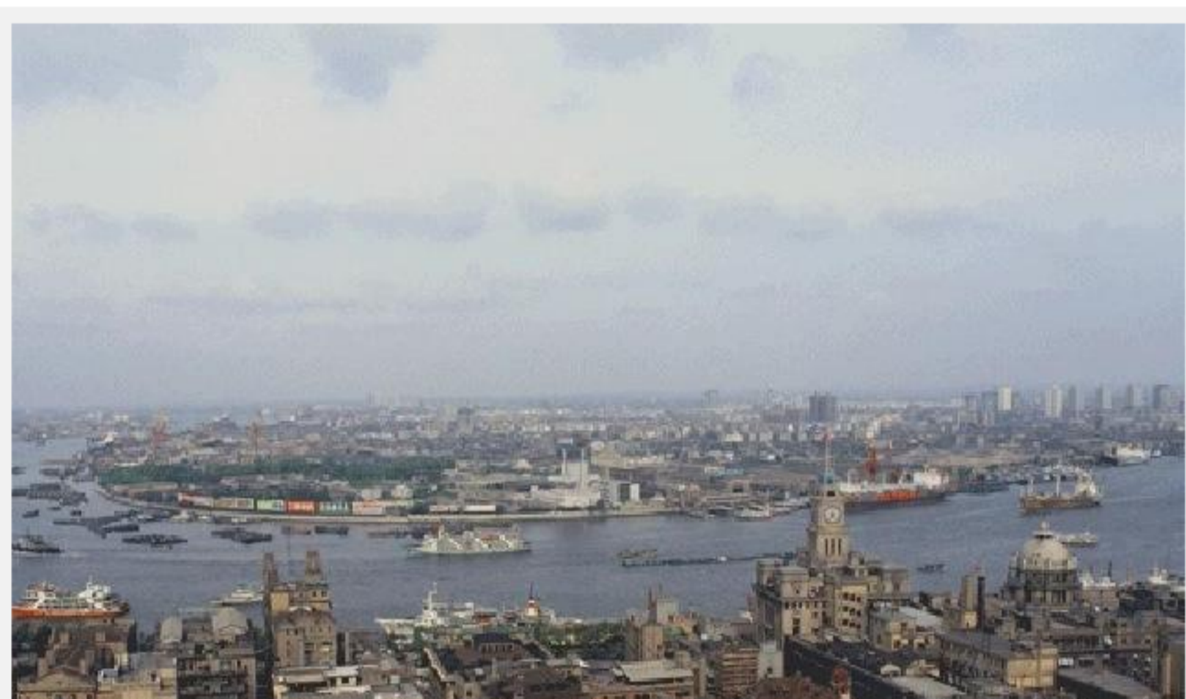
Shanghai en el año 1994