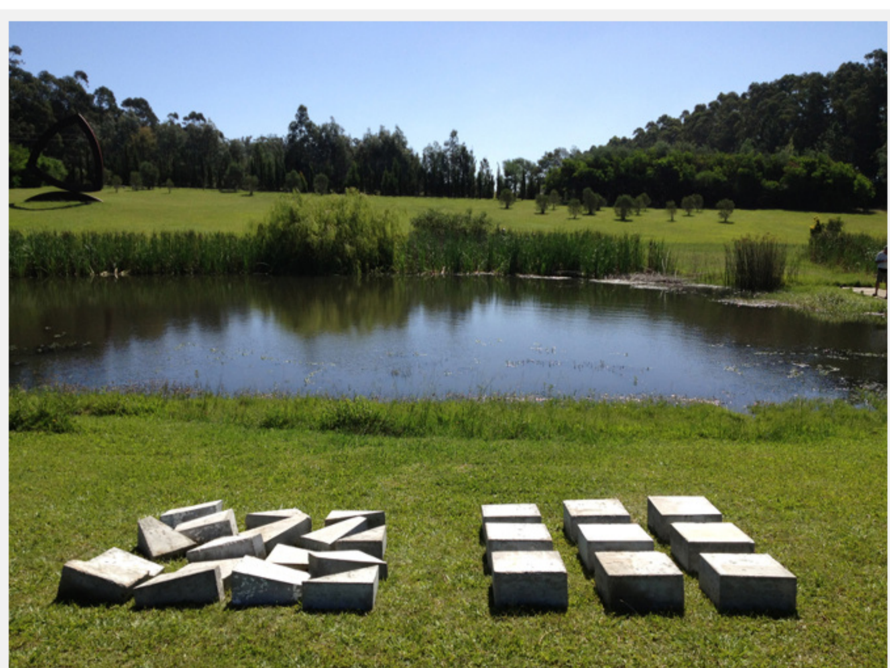
Obra de Luca Benites, año 2012, Colección permanente – Parque de esculturas. Fundación Pablo Alchugary.