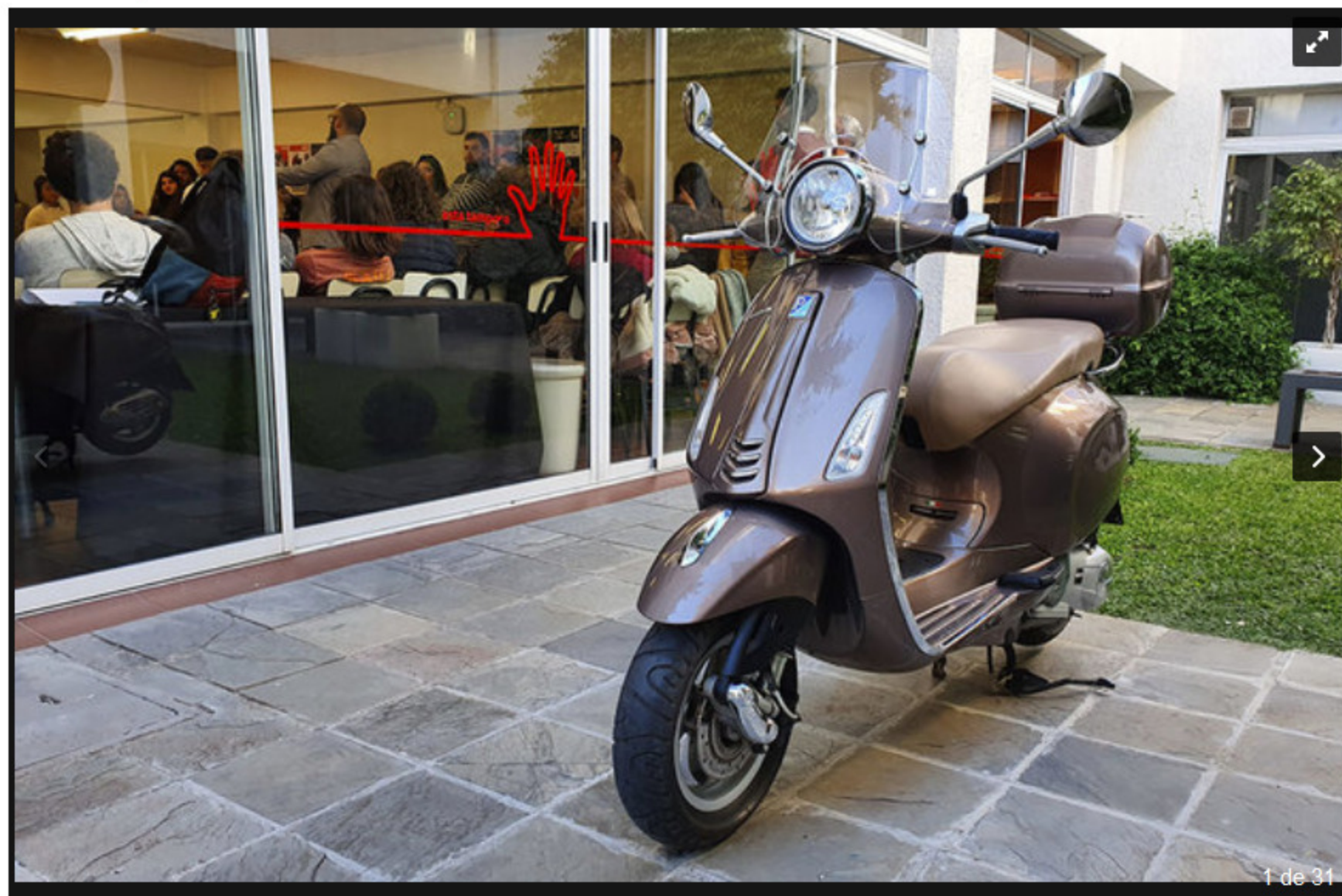
Impecable motoneta Vespa Primavera